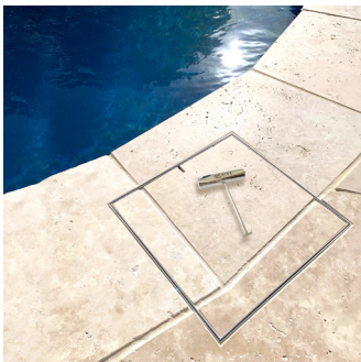
CAJA DE SKIMMER CUBIERTAS