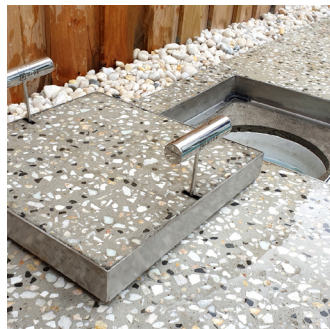
CONCRETO VERTIDO EN HÚMEDO